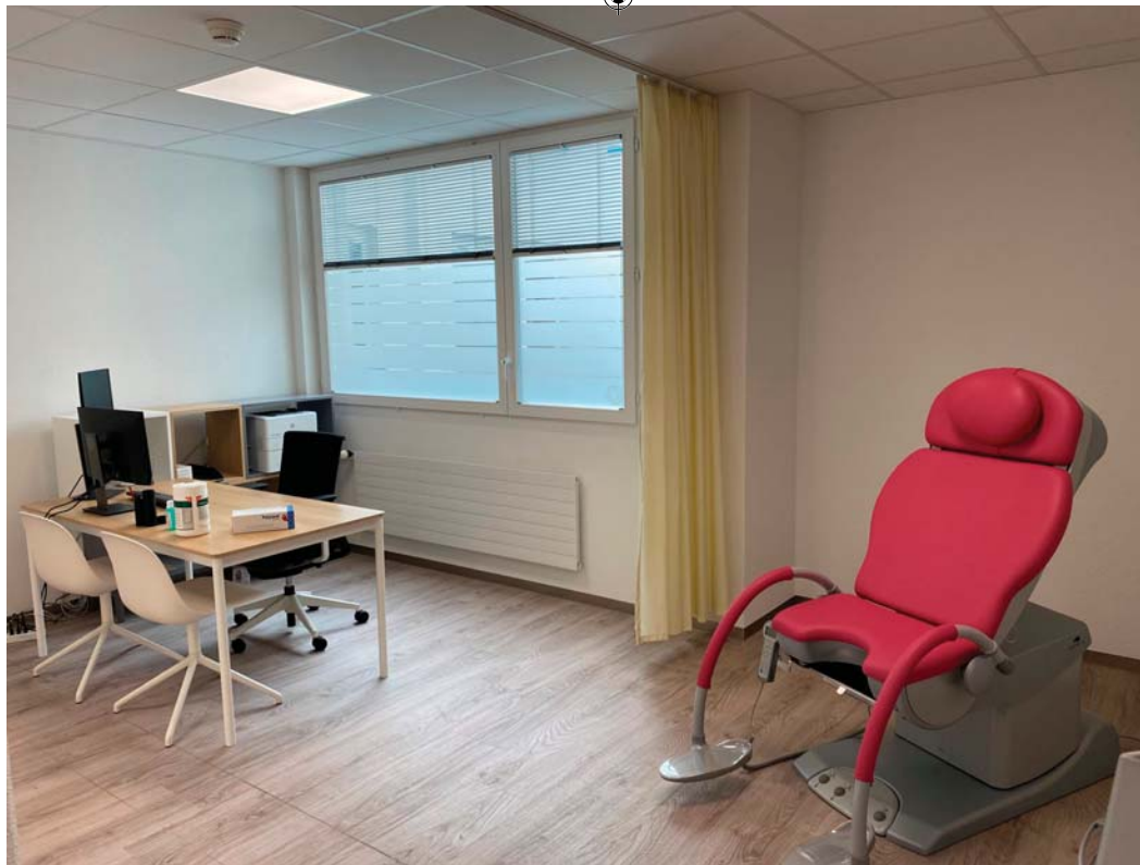
Centre Ados Riviera.

Les labels Minergie sont un des outils à notre disposition pour atteindre une cible globale de consommation en termes de production et de consommation d'électricité ou de chaleur. Par ailleurs, une augmentation du confort va de pair avec la mise en place, par exemple, de ventilations contrôlées.