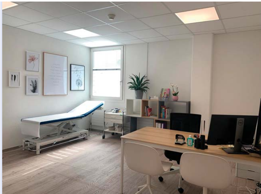
Centre Ados Riviera.

Notre bureau poursuit ses activités avec dynamisme et compétence. Des liens forts se tissent avec les Maîtres de l'ouvrage qui nous ont fait confiance et nous permettent de continuer à œuvrer pour les valeurs auxquelles nous croyons. ■