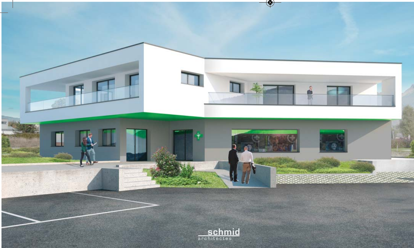
Immeuble résidentiel et commercial à Port-Valais.