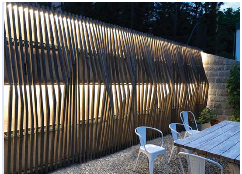
Paroi lumineuse en terrasse.