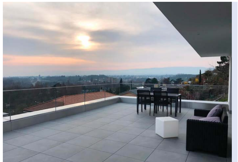
Immeuble résidentiel à Renens.